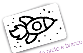
Lado preto e branco